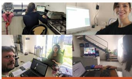
TRIBUNALES SIGUE ABIERTO Y TRABAJANDO

REAFIRMANDO NUESTRO COMPROMISO CON LA SOCIEDAD